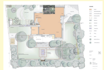
Schnittstelle VectorWorks LANDSCHAFT